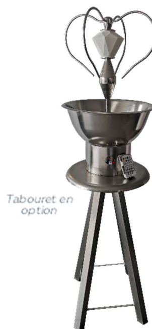
Tabouret en option