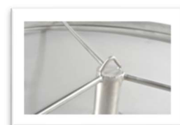
Anneau d'accrochage central