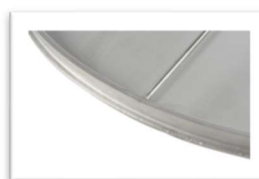
Bordage circulaire Profilé de positionnement chambre à air